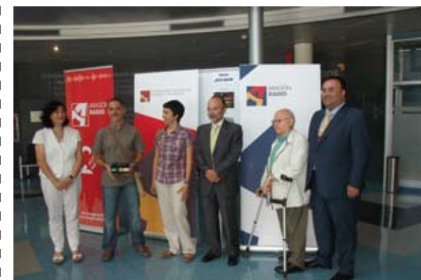
Aragón Radio organizó la exposición ¿Qué es Aragón? en junio de 2009

El Espacio Cultural María Zambrano tiene como objeto proporcionar a los jóvenes creadores aragoneses y servir como una plataforma de exposición y promoción