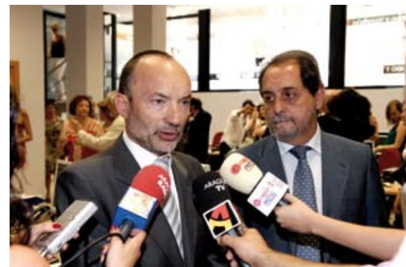
La inauguración de la sede despertó el interés de los medios de comunicación