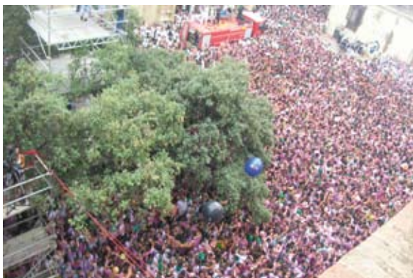
Lanzamiento de globos desde el Ayuntamiento de Huesca

En Huesca, Aragón Radio y Aragón TV volvieron a estar presentes mediante sus respectivos sets y acciones de lanzamiento de globos