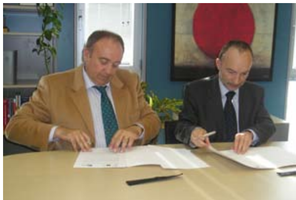
El Secretario General de Virtual Educa en España y el Director General de la CARTV