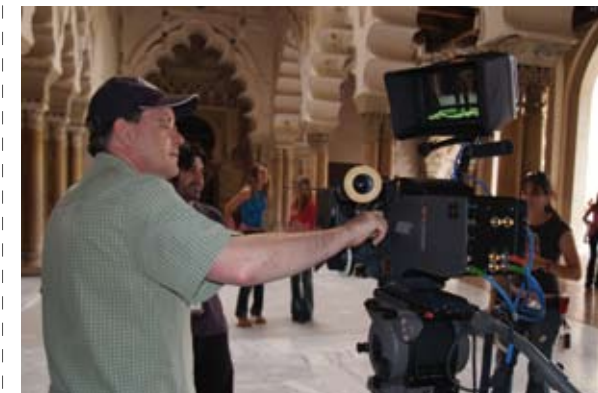
Se ha elevado el nivel de formación técnica en operación de equipos

Además, la concepción de la CARTV, no como una Administración sino como un Servicio Público de calidad, ha exigido un gran esfuerzo de eficacia que pasa por la racionalización en las inversiones tecnológicas y la contención del gasto en políticas de personal. El modelo de gestión televisivo y radiofónico se ha basado en la externalización hacia pequeñas y medianas empresas que prestan sus servicios en el ente y que llegan a conformar un conjunto más o menos homogéneo de profesionales con un fin común.