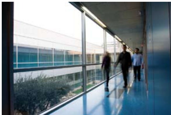
Los trabajadores del Grupo CARTV se caracterizan por tener una edad media relativamente baja