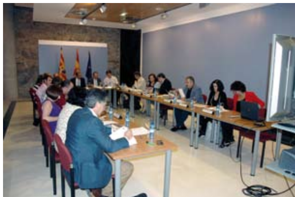
El Consejo de Administración de la CARTV, reunido en Teruel.