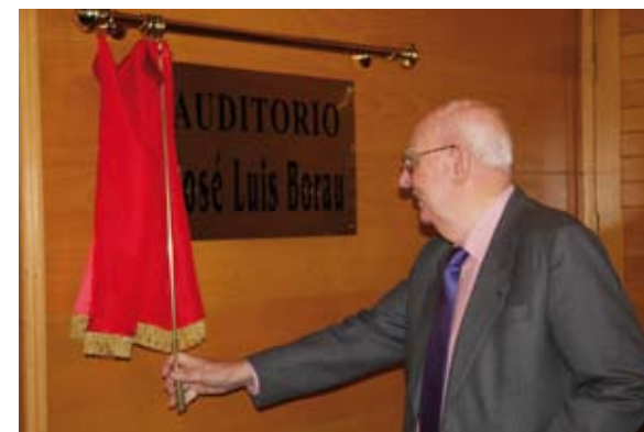
José Luis Borau