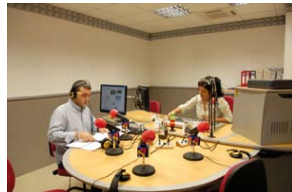
Estudio de Aragón Radio