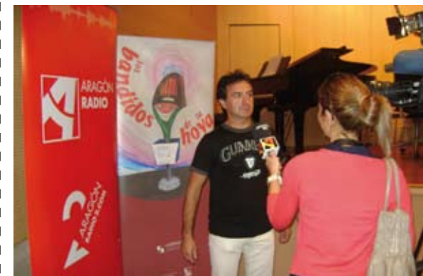
Los Cuentos de la Hoya fueron presentados en la Diputación Provincial de Huesca

• Presentación de Los Cuentos de la Hoya en la Diputación Provincial de Huesca el 28 mayo. El proyecto, impulsado por la Delegación de Huesca junto con la Comarca de la Hoya, se enmarca dentro de la V edición del festival Co-secha de Invierno y tiene como objetivo principal la recopilación y puesta en valor de cuentos y leyendas de la comarca.