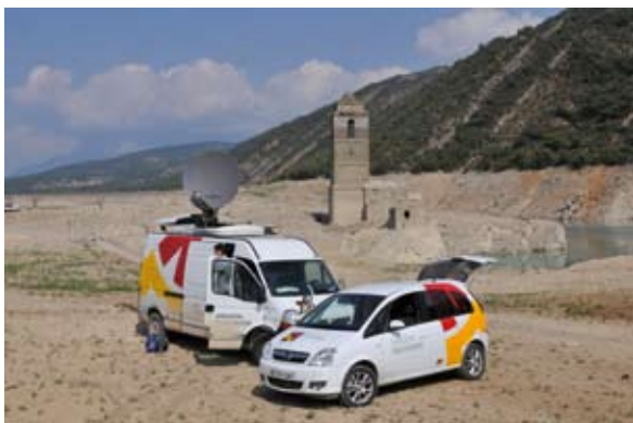
Los equipos de informativos y programas han recorrido más de 70.000 kilómetros por la provincia oscense

Con esta iniciativa, ambas entidades pusieron en valor la tradición oral del territorio favoreciendo la difusión de la imagen legendaria de la Hoya de Huesca.