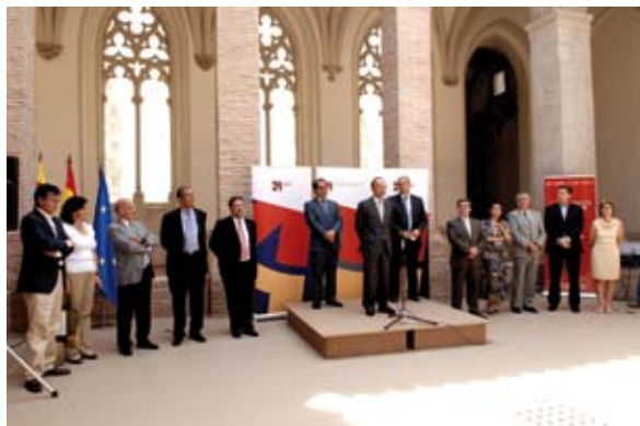
El acto contó con la presencia de las principales autoridades