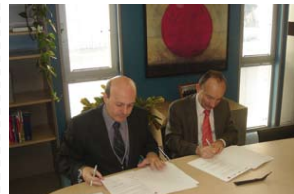
El Vicerrector de Investigación de la UZ y el Director General de la CARTV