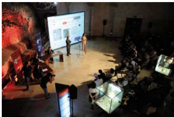
Presentación de la temporada 2009/2010, "Aragón Radio, la radio que nos une, la radio que te escucha"