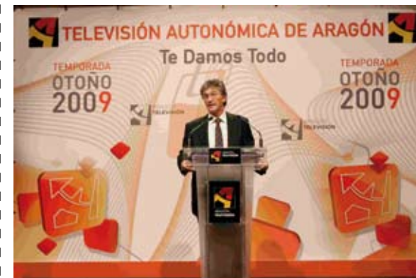
Presentación de la programación "Otoño 2009" en el World Trade Center de la capital aragonesa

Durante el 2009, el departamento de Prensa también se ha encargado de la actualización diaria del servicio de teletexto