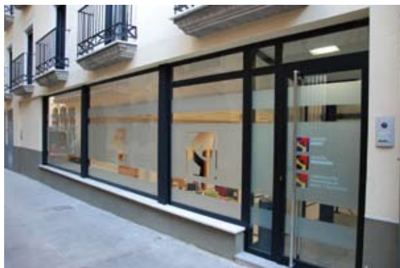
Delegación de la CARTV en Teruel

La delegación de la Corporación Aragonesa de Radio y Televisión en Teruel desarrolló su actividad durante el año 2009 con un total de 33 personas, pertenecientes a las productoras que prestaron servicios a la CARTV en diferentes ámbitos y en situaciones diversas, como sustituciones, servicios técnicos, programas e informativos, además del personal propio adscrito a las sociedades Aragón TV y Aragón Radio.