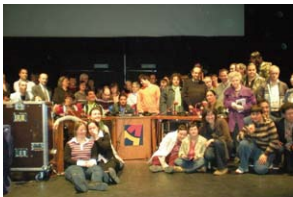
CADIS realizó un programa en directo para Aragón Radio desde Huesca

3. Convenio entre Aragón Radio y Asociación de Educación y Formación no Presencial Virtual Educa para la colaboración entre las dos entidades. Específicamente, es objeto del Convenio el compromiso entre las partes de que www.aragonradio 2.com será la emisora oficial de Virtual Educa.