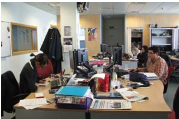
Delegación de la CARTV en Huesca