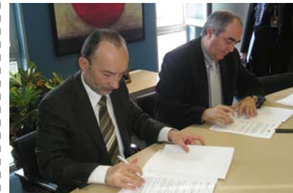
El Director General de la CARTV y el Presidente del Consejo Aragonés de Cámaras de Comercio e Industria

2. Acuerdo entre Aragón Radio y el Vicerrectorado de Investigación de la Universidad de Zaragoza (Instituto de Investigación en Ingeniería de Aragón (I3A) para la Licencia de Uso de los datos cedidos por la Corporación Aragonesa de Radio y Televisión al Instituto de Investigación en Ingeniería de Aragón (I3A)/Universidad de Zaragoza.