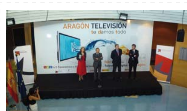
Acto institucional para celebrar la implantación del la primera fase del "Apagón Analógico"

a) Investigación en emisiones de TDT en Alta Definición con desarrollos en interactividad, NVOD o televisión a la carta y nuevos equipos de emisión avanzada.