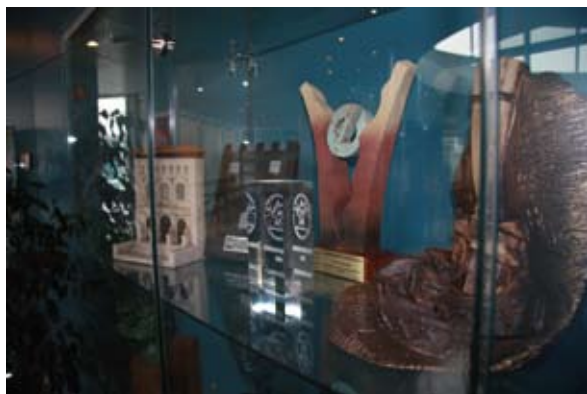
Vitrina con galardones en la sede de la CARTV

Aragón TV recibió a lo largo de 2009 varias distinciones y reconocimientos. Su labor fue premiada en el marco del XX Congreso Aragonés de Atención Primaria, recibió el Premio CERMI por su compromiso hacia las personas con diferentes discapacidades, el premio de las Jornadas 2009 Ruta del Tambor y del Bombo, el galardón de la Asociación del perro-guía de Aragón, de Helios y de la Federación de Atletismo por su compromiso con el deporte y de ADEMA por su compromiso social y divulgación de la esclerosis múltiple.