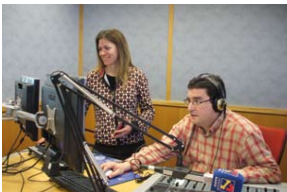
La Delegación de Huesca está integrada por 22 personas