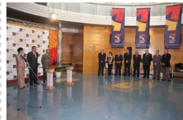
La Radio Autónoma firmó un convenio con diversos ayuntamientos para la redifusión de su señal y contenidos

23. Convenio entre Aragón Radio y el Ayuntamiento de Cuarte de Huerva para la cesión de la señal y contenidos de Aragón Radio por las emisoras locales en régimen de gestión directa.