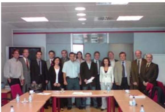
Miembros de la Plataforma TDT HD