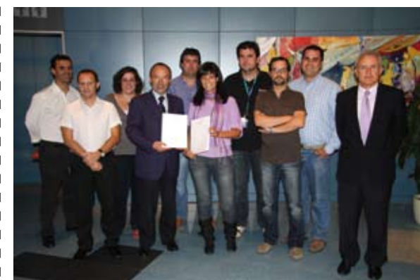
La Dirección General de la CARTV y la representación legal de los trabajadores

El Convenio, que afecta a un total de 140 trabajadores, se aproxima a convenios colectivos de otras corporaciones públicas similares, como es el caso de Castilla-La Mancha, Asturias o Ib3.