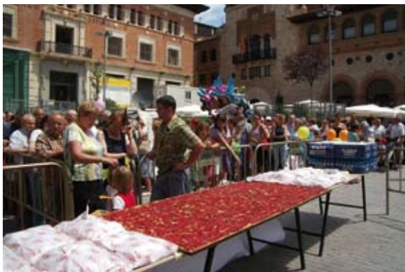
Reparto del tradicional Regaño Gigante